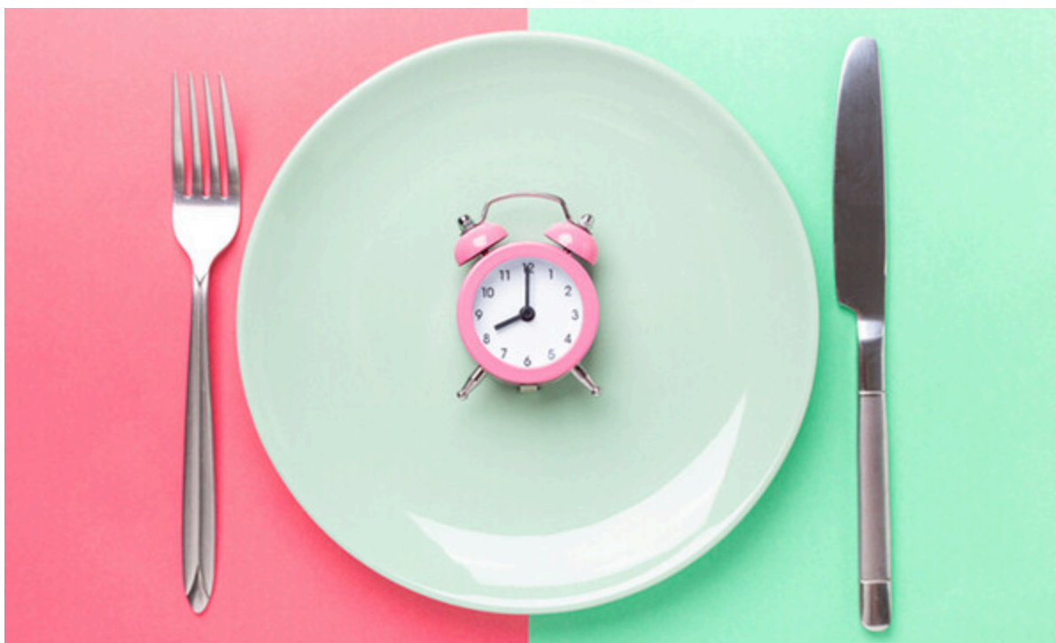
다이어트의 관건은 공복유지다.

다이어트의 관건은 공복유지다. 8시간 공복 상태가 이어지면 우리 몸의 위장은 완전히 비워진 상태가 되고 12시간이 지나면 간에 쌓여 있는 지방세포들이 분해되기 시작한다. 또 18시간이 지나면 지방 대사가 몸 전신에서 일어나 체지방 감량 효과가 발생한다.